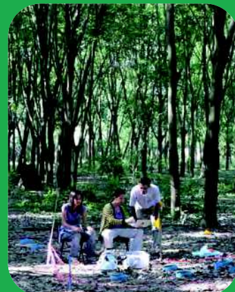
Mesure de la respiration du sol en plantation d'hévéas, Thaïlande