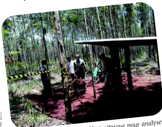
Mise en place d'un dispositif lysimétrique pour analyser les éléments en solution du sol.