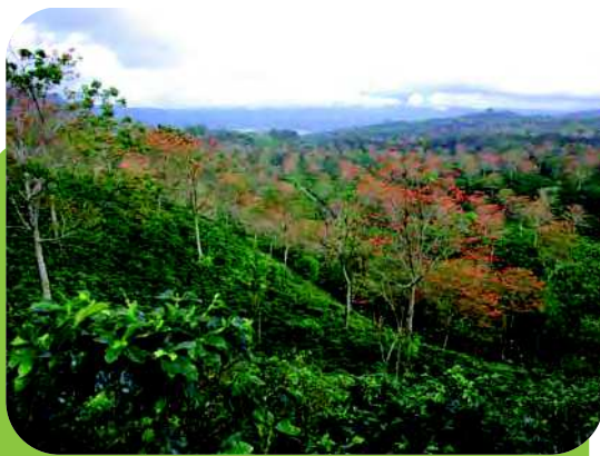
Caféiers sous ombrage d' Erythrina poeppigiana (légumineuse), Costa Rica

L es changements climatiques et les pressions sur les terres risquent d'augmenter la dégradation et la fragmentation des forêts naturelles et, avec elles, la perte des fonctions et des services qu'elles remplissent. Face à ces menaces, les plantations forestières et les systèmes agroforestiers sont appelés à jouer un rôle croissant, à condition d'être gérés durablement.