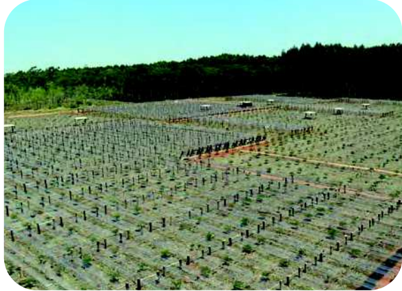
Etude de l'impact de la réduction des pluies et de la fertilisation (K) sur plantation d' Eucalyptus grandis , Brésil

L'écologie fonctionnelle étudie les fonctions des organismes en interaction avec leur environnement. Cette discipline est mise en œuvre par le Cirad pour caractériser le fonctionnement des plantations forestières et des systèmes agroforestiers, et les impacts environnementaux associés. Une approche écosystémique, appuyée sur une méthodologie et des outils propres, permet d'étudier de manière dynamique les flux d'eau, de carbone et d'éléments minéraux.